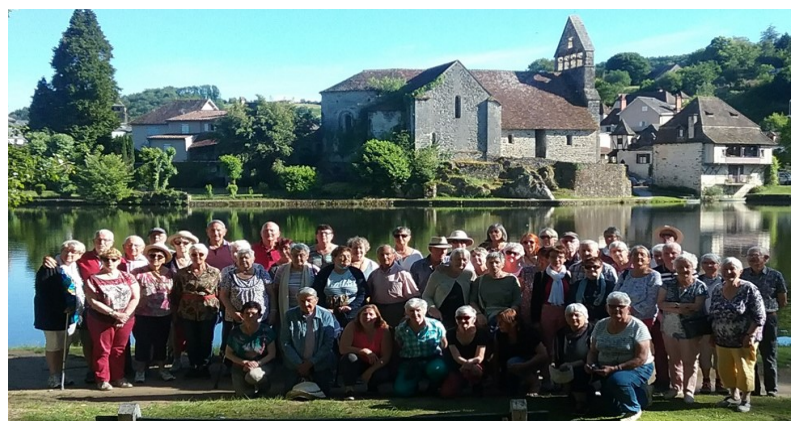
L'équipe de la première cuvée